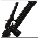
Poly Spray Handle Poignée de pulvérisation en plastique