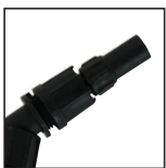
Adjustable Nozzle Buse conique ajustable