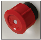
Pressure Relief Valve Soupape de décharge