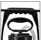
Folding Carry Handle Poignée de transport repliable